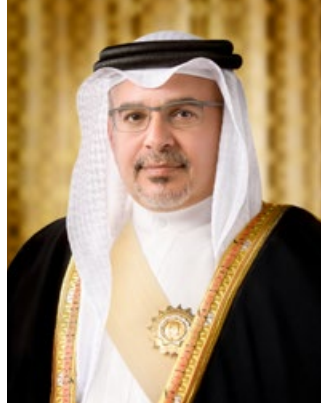
صاحب السمو الملكي الأمير سلمان بن حمد آل خليفة ولي العهد رئيس مجلس الوزراء مملكة البحرين