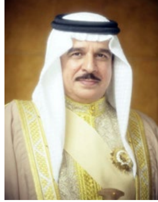
حضرة صاحب الجلالة الملك حمد بن عيسى آل خليفة ملك مملكة البحرين المعظم